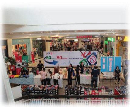
ห้างแม็คโคร สาขาทุ่งสง