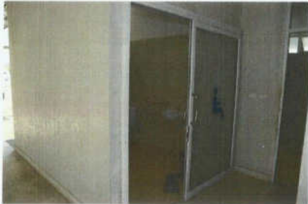
ห้องน้ำสำหรับคนพิการและผู้สูงอายุ