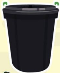
ถังน้ำ 66 ลิตร