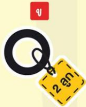
ลูกยางกันซึม 1.5 นิ้ว 2 ลูก