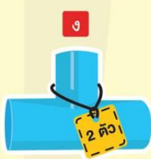
ข้อแยกสามทาง 1.5 นิ้ว 2 ตัว